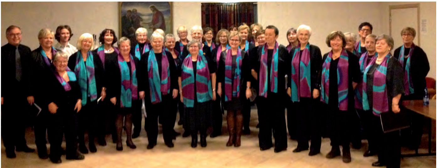
SYNGER SEG GLAD: Damekoret Toneveld sitt motto er: «Ingen for liten, ingen for stor. Kom og syng deg glad i vårt kor».

Hosanger kyrkje, laurdag 7. mai kl. 18.00. Billettar kr. 100,- for vaksen, kr 50,- for student, medan born under 12 år går gratis. Billettar kan tingast hjå Osterøy kyrkjekontor i Lonevåg, tlf. 56192280.