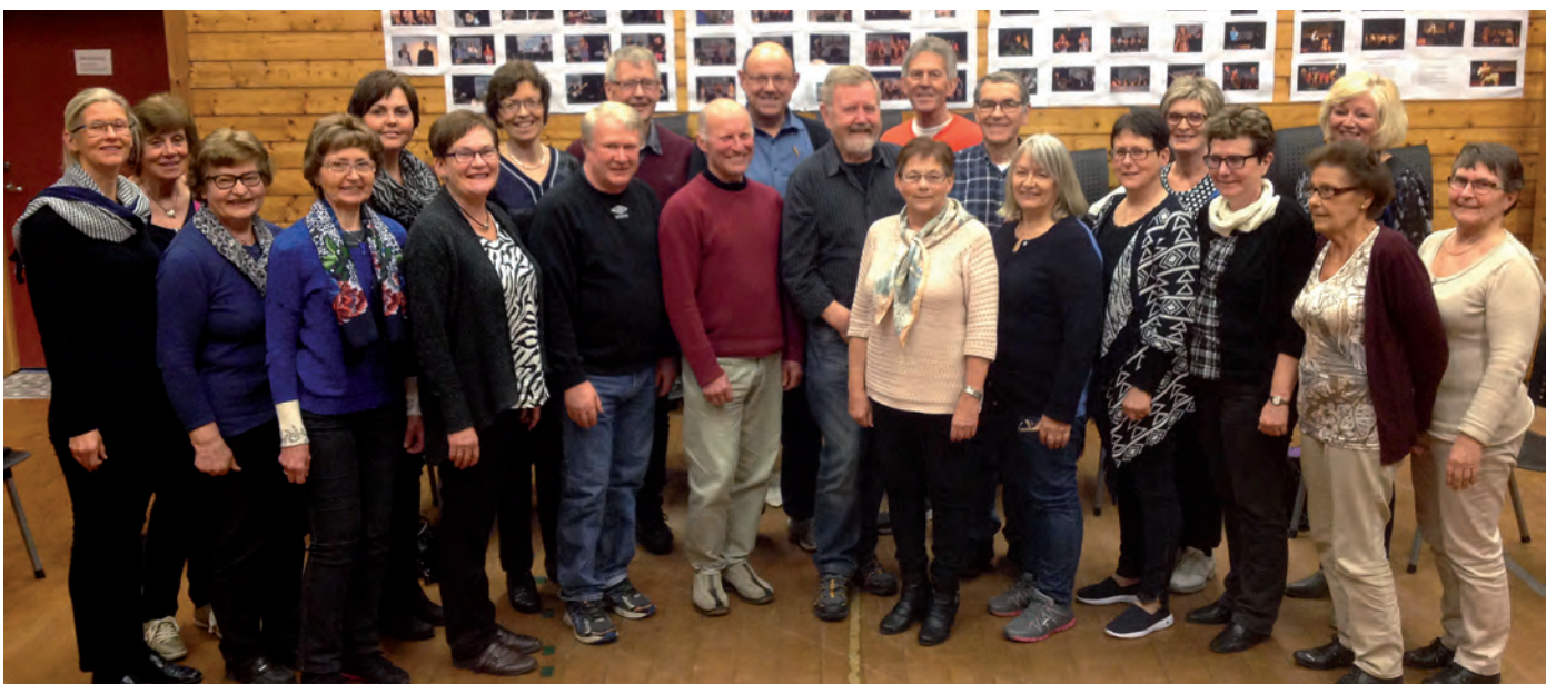
KJEM TIL HOSANGER: Tysnes Kammerkor tel 24 songarar, og er eit direkte framhald av blandakoret «Kor som helst»..