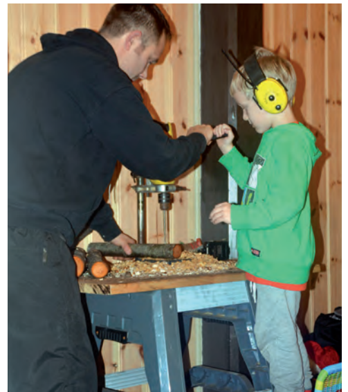
JULEVERKSTAD: Fuglematar-produksjon i kyrkja.

Etter påfyll av ny energi, kunne dei som ville arbeida vidare. Både barn og vaksne såg ut til å kosa seg. Ein god replikk frå ein av gutane kan summera opp opplevinga denne ettermiddagen: «Mamma, best day ever».