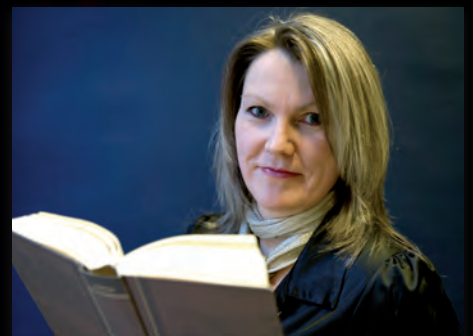
Inviterar til Bibelfestival