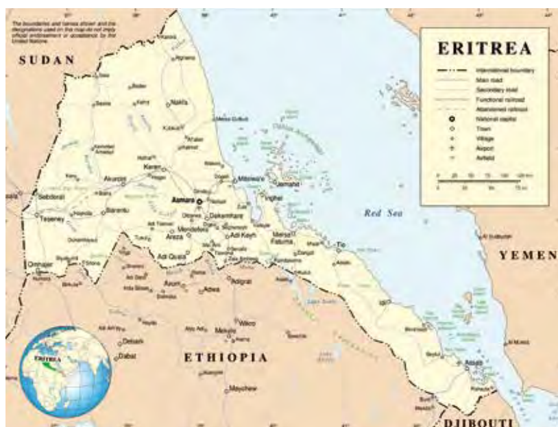
PÅ AFRIKAS HORN: Eritrea ligger nordøst i Afrika, med grenser mot Sudan i nordvest, Etiopia i sør, Djibouti i sørøst, og med kystlinje mot Rødehavet i øst.