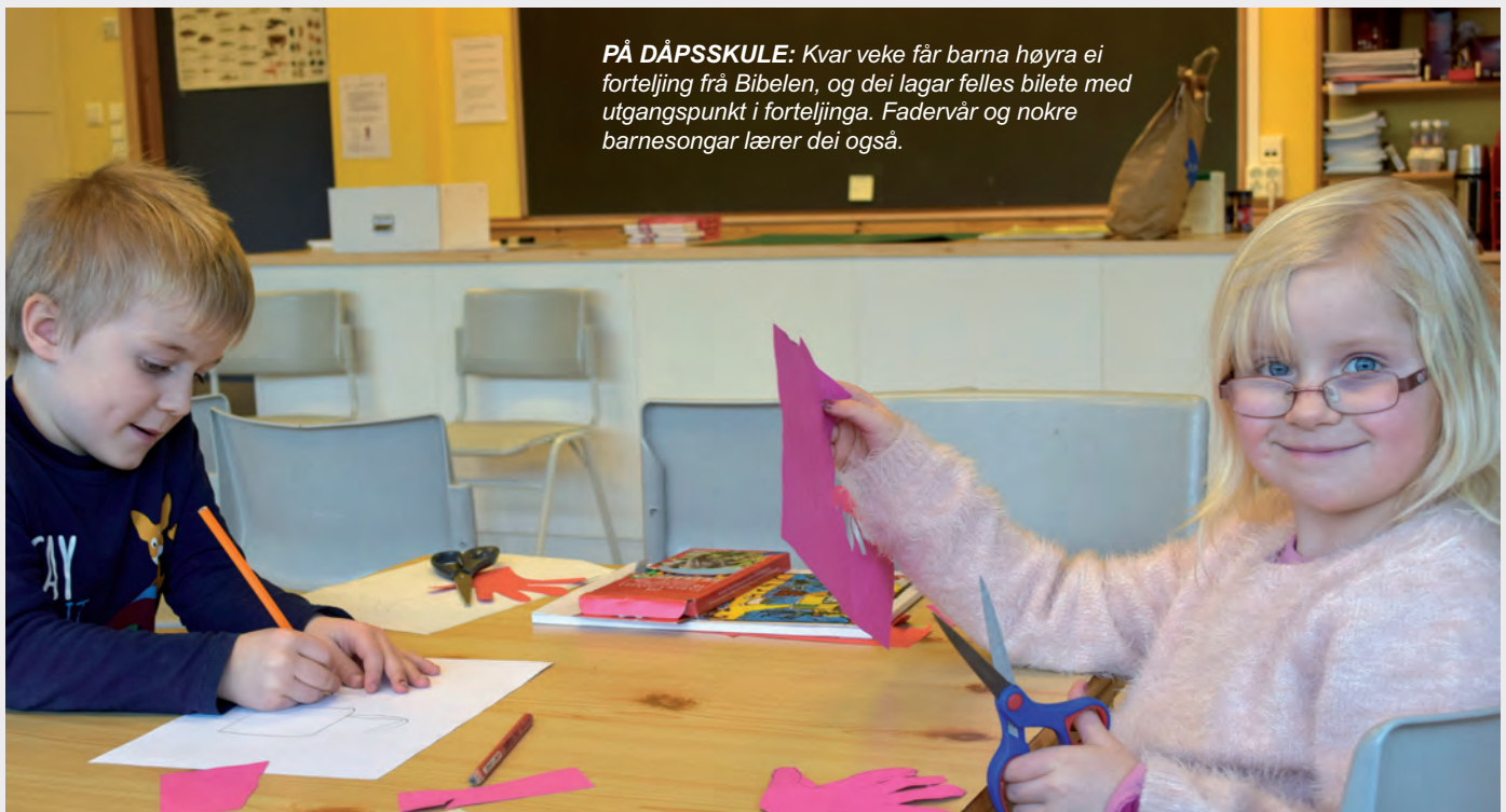
PÅ DÅPSSKULE: Kvar veke får barna høyra ei forteljing frå Bibelen, og dei lagar felles bilete med utgangspunkt i forteljinga. Fadervår og nokre barnesongar lærer dei også.

På nettsida osteroy.kyrkja.no ser ein kva som kjem av tilbod for barn og unge. Det kan vera lurt å følgja med der. Informasjon finn ein også på Facebook (søk KyrkjaOsterøy). Brosjyrar om trusopplæring ligg i kyrkjene og på kyrkjekontoret.