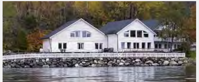
STILLA I NATUREN: Holmely ligg i sjøkanten, like ved riksveg 15 på Bryggja i Nordfjord, med flott utsyn mot fjell og fjord.

Store delar av laurdagen er sett av til pilegrimstur til øya Selja. Brosjyre er lagt ut på nettsidene til Bjørgvin bispedøme og Holmely ( www.holmely.no og www.retreater.no/retreatsted/holmely ). Pris per person: Dobbelrom kr. 2700,- / enkeltrom kr. 2900,-.