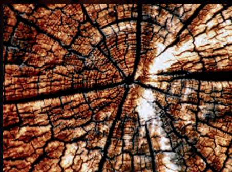
Alt om Påskefest 2016