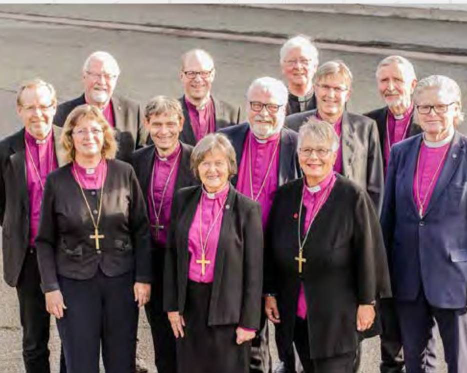
ØNSKER LITURGI FOR LIKEKJØNNET EKTESKAP: Biskopene ser ulikt på spørsmålet om likekjønnet vigsel, men har likevel arbeidet seg frem til en enighet om hvordan kirken bør gå videre i denne saken.

Kirkerådet har nå gitt sin tilslutning til Bispemøtets forslag om at Kirkemøtet skal vedta liturgier for ekteskapsinngåelse mellom likekjønnede.